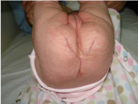
Figura 2 Post-operatorio inmediato tras la resección de la tumoración y del coxis.

ción los padres 4,5 . Aunque en la mayoría de los fetos es posible programar la finalización de la gestación y la resección del tumor, es importante este seguimiento ecográfico intensivo para identificar a aquellos con riesgo de desarrollar hydrops 1,6 , ya que una intervención fetal en el momento adecuado puede revertir la fisiopatología del proceso antes de haberse alcanzado la viabilidad fetal. Sobre todo en casos de masas sólidas grandes de rápido crecimiento y con una importante vascularización es necesario un seguimiento aún más estricto con ecografías seriadas y ecocardiografía. Sin embargo, la ecografía resulta incompleta para evaluar eficazmente la masa tumoral o los cambios hemorrágicos en el seno del tumor, la invasión intraespinal o la extensión intrapélvica. Gracias al desarrollo de RM de alta velocidad, está aumentando la aplicación de esta técnica en el diagnóstico fetal ya que no es necesario la sedación ni la parálisis fetal. La mayoría de los autores concluyen que la RM es útil para la planificación de la cirugía de resección posterior ya que permite un estudio multiplanar del tumor y aporta información adicional en cuanto a la extensión del tumor y su composición, ambos factores importantes en el pronóstico 7 .