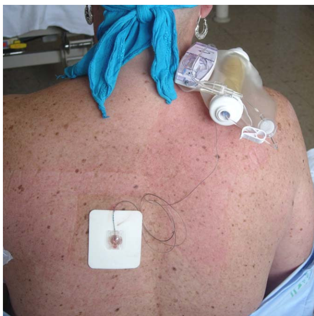
Figura 1 Bloqueo paravertebral torácico izquierdo con catéter y bomba elastomérica.

Mujer de 38 años de edad, ASA II, con antecedentes personales de fumadora, bebedora de 40 g/día, intento de autólisis, litiasis renal de repetición e intervenida de cesáreas (3 veces), ligadura tubárica bilateral y fibroadenoma de mama izquierda hace varios años. Es remitida a la unidad de mama desde atención primaria por un nódulo en la mama izquierda hallado por autopalpación. Tras la realización de la mamografía, ecografía, RM y biopsia, se decide tratamiento con quimioterapia neoadyuvante con paclitaxel y adriamicina por carcinoma lobulillar infiltrante de 4,5 cm (T 2 N 1 M x ) en el cuadrante superointerno de la mama izquierda (6 ciclos cada 21 días). El quinto ciclo se pospuso por alteraciones cardíacas, con disfunción de la relajación pericárdica sistólica y una fracción de eyección del 39%. Tras la finalización de las sesiones de quimioterapia, en la RM se halla una moderada disminución del tamaño tumoral (3 cm), con una disminución de la captación del contraste en la fase temprana de la lesión