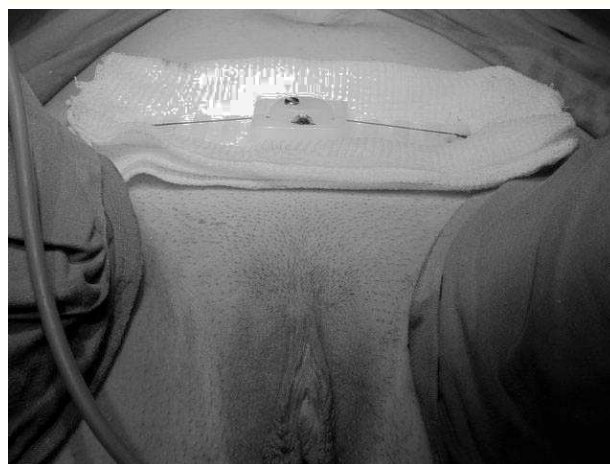
Figura 3. Tracción de los hilos por el dispositivo Remeex.

La paciente debe permanecer con sonda vesical los primeros 4 días hasta que el botón se haya introducido 4 cm y no comprima la uretra. El mecanismo se ajusta diariamente a razón de 10 vueltas, lo que equivale a 1 cm. A los 8 días se secciona el hilo y se retiran el botón y el dispositivo tractor.