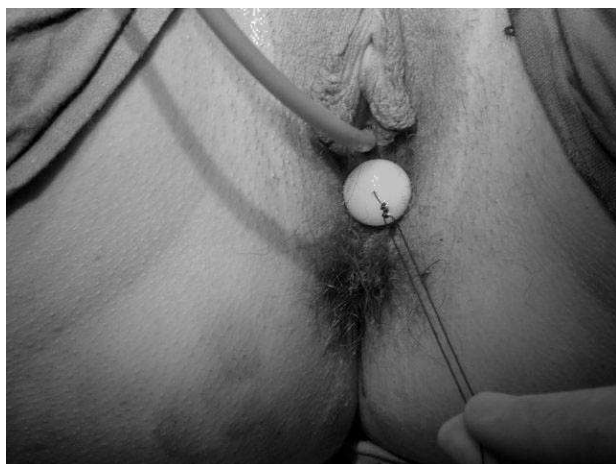
Figura 1. Botón situado en el receso retrohimenal.

Con una aguja de 20 cm de longitud, se introducen ambos extremos del hilo en la cavidad abdominal, quedando el botón fijado en el otro extremo (fig. 1). Se retira la vaina de 5 mm y se hace descender, labrando un trayecto por el espacio preperitoneal, hasta aflorar por el espacio diseccionado, utilizando la hidrodisección. Se introduce una pinza con la que se agarra el hilo, que se hace salir por el orificio del trocar (fig. 2). Dicho hilo, en cada lado, penetra en la pieza de plástico y se va a anudar en el dispositivo Remeex (fig. 3). Los hilos tractores quedan extraperitoneales e introducen el botón hacia dentro, invaginando la mucosa vulvar.