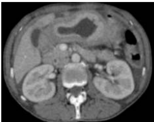
Figura 1 Linitis plástica de antro-cuerpo gástrico en imagen tomográfica, la anatomía patológica informó de adenocarcinoma infiltrante pobremente diferenciado ulcerado y necrosado.

Tanto la sintomatología como los hallazgos endoscópicos, radiológicos e incluso histológicos, con la presencia de células en anillo de sello, pueden ser muy similares entre los cánceres gástricos primarios y metastásicos de mama 3 .