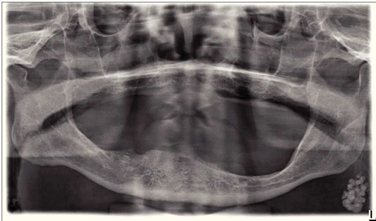
Figura 2. Radiografía panorámica: en la zona caudal del ángulo mandibular izquierdo se visualiza una estructura ovalada, hiperdensa, segmentada, lobulada y bien delimitada, patognomónica de un ganglio linfático calcificado.

Si la causa de estos cuadros es bacteriana, se pueden formar abscesos crípticos en el tejido linfático de las amígdalas o del anillo faríngeo de Waldeyer. En determinadas circunstancias curan dejando una cicatriz, lo que a la larga favorece la aparición de calcificaciones. Es muy frecuente que estas alteraciones se proyecten en las radiografías panorámicas sobre la rama mandibular (fig. 1). Es posible que, en función del momento en que se obtuvo la radiografía panorámica, hayan pasado varios años