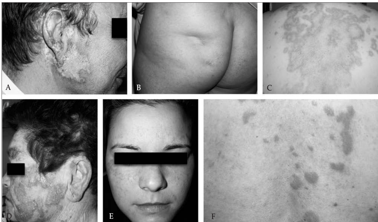
Figura 2. A. LECC. Lesión tipo lupus eritematoso discoide; B: Paniculitis lúpica. Depresión cutánea por atrofia del pániculo adiposo; C: LECS anular. Lesiones de morfología anular en la espalda; D: LECS psoriasiforme. Placas eritematoescamosas en la cara; E: Pápulas y maculas eritematosas en el dorso de la nariz y las mejillas configurando el clásico rash malar; F: Lupus tímido. Pápulas y placas eritematosas infiltradas en la espalda.

ratina en el interior del ostium folicular (Fig. 2A). Estas lesiones siguen una evolución tórpida dejando en su zona central áreas de despigmentación, telangiectasias y atrofia o cicatriz. Esta apariencia clínica permite sospechar el diagnóstico con facilidad, si bien los hallazgos microscópicos permiten confirmarlo. Entre ellos destacan la degeneración vacuolar o hidrópica de la capa basal, cierto grado de atrofia de la epidermis y un infiltrado compuesto por linfocitos, dispuesto de manera parcheada alrededor de los vasos y los anejos (37) . Todo ello hace que sea innecesario realizar, en la mayoría de las ocasiones, un estudio de inmunofluorescencia directa (IFD) para establecer el diagnóstico (38) . La luz solar puede exacerbar las lesiones o, incluso, en algunos pacientes inducir las mismas, pero raramente el paciente relaciona la aparición de las mismas con la exposición a la radiación ultravioleta.