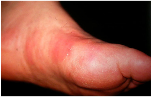
Figura 1 – Tromboflebitis superficial migratoria que afecta a las venas del pie.