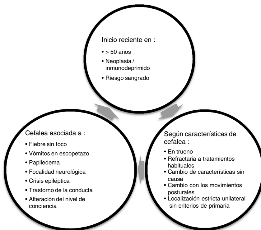
Figura 1 Signos y síntomas de alarma a considerar ante un paciente con cefalea («red flags»).

2 publicaciones; esta centrada en las cefaleas y neuralgias craneofaciales primarias y luego una cuyo objetivo son las cefaleas y neuralgias secundarias.