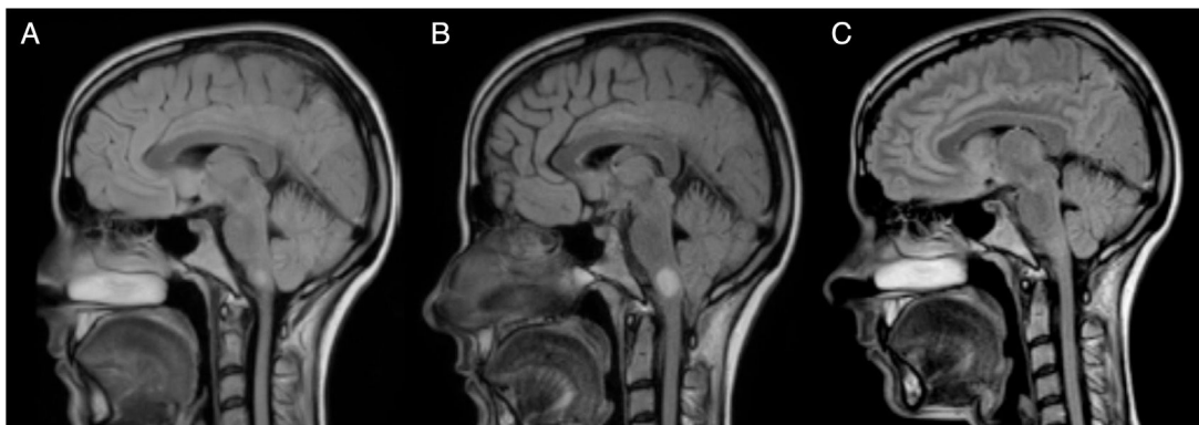
Figura 1 Evolución de la lesión hemibulbar derecha. En la RM B, realizada con un mes de diferencia de la RM A y a los 15 días del shock cardiogénico, se aprecia el aumento de tamaño de la lesión hemibulbar derecha que pasa de medir 7 a 13 mm. En la RM C, realizada un año después de la B, se puede apreciar la remielinización de la lesión.

descarga catecolaminérgica por estrés. En la primera se ha propuesto que una infección viral activaría la respuesta inmunitaria en la EM a nivel de SNC, pudiendo afectar a nivel cardíaco produciendo una miocarditis que resultaría en una disfunción del VI 8 . En nuestro caso, no se detectó una infección viral activa ni signos de miocarditis en la biopsia del músculo cardíaco. La segunda teoría propone una disminución de los fosfatos de alta energía (fosfocreatina y ATP) en los pacientes con EM sin ninguna manifestación clínica cardíaca, que sugeriría una afectación subclínica 9 . La tercera hipótesis está relacionada con la localización de las placas de desmielinización, ya que, las lesiones situadas en el núcleo del tracto solitario, el área postrema y la médula caudal, que funcionan como conexiones simpáticas entre el hipotálamo y la médula 10 , podrían alterar esta vía. La localización bulbar de la lesión que presenta nuestra paciente no es uno de los territorios que más se repite en la literatura. Sin embargo, al encontrarse cercana al núcleo dorsal del vago implicado en el control autónómico, podría explicar la disfunción autónómica en nuestra paciente, de igual forma