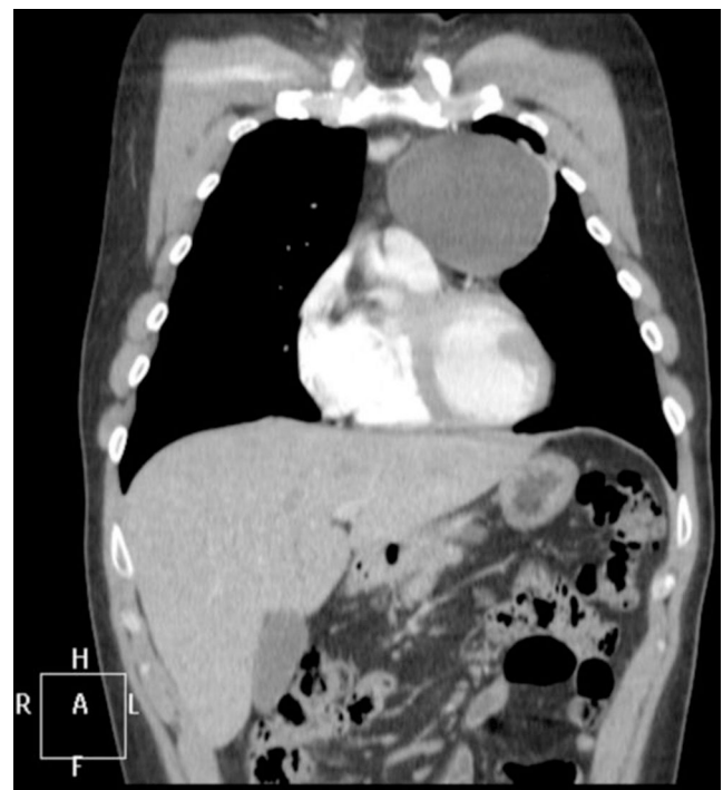
Figura 1 TC de tórax. Masa en el mediastino anterior indicativa de quiste tímico.

Al diagnóstico se inició tratamiento con piridostigmina 60 mg cada 8 h, logrando mejoría parcial de la ptosis y la debilidad orolingual, por lo que un mes después se añadió