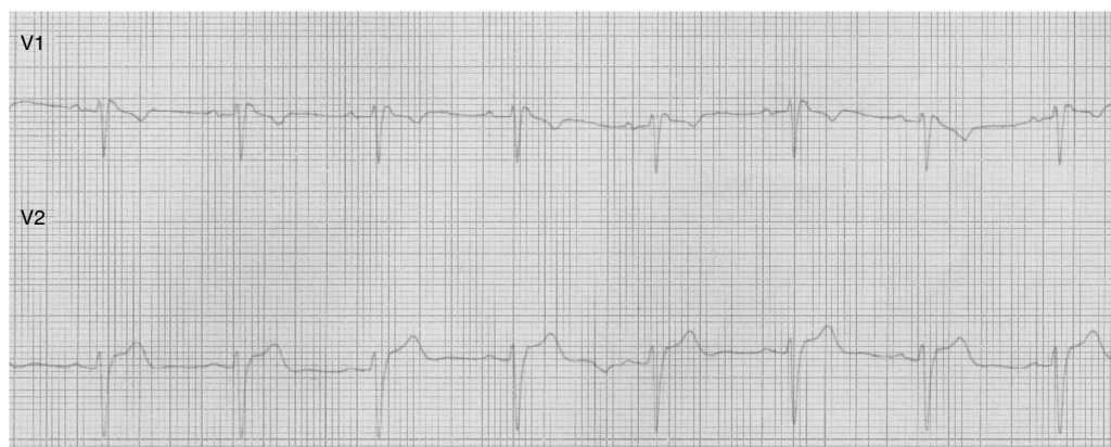
Figura 2 ECG derivaciones V1-V2 que muestra complejo QRS con patrón rS' en V1 y segmento ST cóncavo hacia arriba y mínimamente supradesnivelado en V2.

un caso de fiebre y alteraciones de conducción cardiaca en 2 pacientes 9,10 .