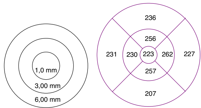
Figura 1 Grosor macular en un paciente con brote de neuritis óptica de más de 6 meses de antigüedad en el ojo derecho. Medida de las 1.000, 3.000 y 6.000 micras.

Para el análisis cuantitativo del grosor macular se utilizó el protocolo Retinal Thickness/Volumen Tabular. Mediante este programa, se obtuvieron 2 mapas circulares que nos permitieron cuantificar el grosor en las 1.000, 3.000 y 6.000 micras centrales respecto a la fóvea, aunque solo se analizó el grosor de las 1.000 y 3.000 micras.