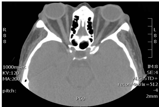
Figura 1 Tomografía computarizada en la que se observa exoftalmos axial bilateral y asimétrico más pronunciado en el OD y elongación del nervio óptico.

Se realizó descompresión orbitaria en primer lugar del OD, interviniéndose la pared medial y del suelo de la órbita por vía endoscópica por fosa nasal y la pared lateral por vía externa, sin complicaciones.