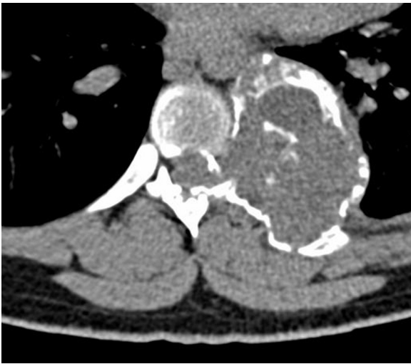
Figura 1 TAC de columna vertebral: lesión osteolítica sobre el arco posterior de la 7. a costilla izquierda que destruye el pedículo y la parte posterior del cuerpo vertebral.

La presentación clínica del osteoclastoma a nivel de la columna vertebral suele ser el dolor 4 , pudiendo desarrollar clínica radicular y de forma más rara diferentes grados de paraplejía debido a compresión medular 3-5 .