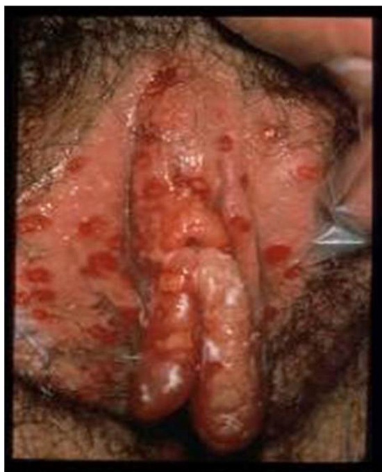
Figura 1. Lesiones ulcerosas en vulva. Modificado de Garland y Steben 13 .

anogenitales. Conforme a estos cambios, debemos romper con la tradicional afirmación de que VHS-2 es igual a herpes genital y que el VHS-1 se limita a infecciones orolabiales con transmisión no sexual.