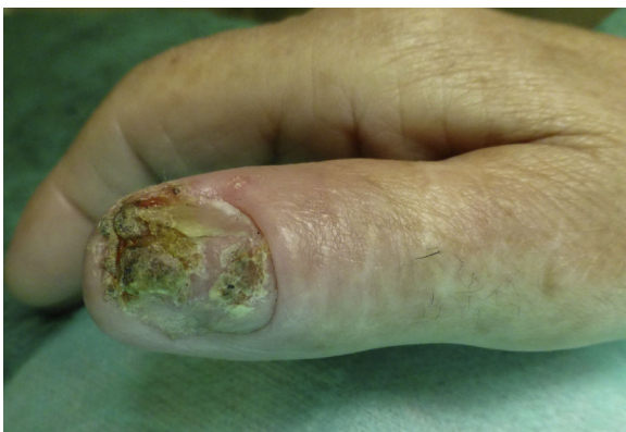
Figura 1. Placa hiperqueratósica que compromete la totalidad del lecho ungueal del primer dedo de la mano derecha.

Mujer de 86 años que consultó por una lesión ungueal de 4 meses de evolución que relacionaba con un traumatismo 6 meses antes del inicio del cuadro clínico. En la exploración se evidenció una placa hiperqueratósica que comprometía la totalidad del lecho ungueal del primer dedo de la mano derecha (fig. 1). No asociaba adenopatías locorregionales ni sintomatología sistémica. Se solicitó una radiografía simple del dedo que no mostró afectación ósea, un hemograma, una bioquímica y un estudio de inmunidad cuyos resultados estaban dentro de la normalidad.