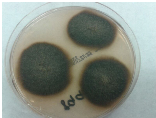
Figura 1. Colonias algodonosas oscuras en agar Sabouraud-dextrosa, después de 10 días de incubación a 30 °C.

La secuenciación de nucleótidos con cebadores ITS-1 e ITS-4 reveló el 98% de similitud de secuencia con Phaeoacremonium fuscum usando la base de datos GenBank BLAST. Posteriormente, la Unidad de Micología del Centro Nacional de Microbiología (Madrid, España) confirmó la identificación de Phaeoacremonium fuscum , con la siguiente sensibilidad realizada por metodología EUCAST 1 :