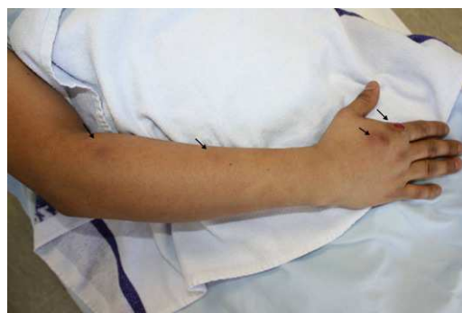
Figura 1. Las flechas señalan varios nódulos en la extremidad superior derecha, eritemato-violáceos, de trayectoria ascendente, el más distal de ellos ulcerado.

En las siguientes 2 semanas le aparecieron nuevas lesiones en el brazo derecho, por lo que se inició tratamiento con itraconazol 200 mg/día, con la sospecha de esporotricosis linfocutánea. La tinción de Gram, el cultivo anaerobio y de micobacterias fueron negativos. La biopsia cutánea mostró infiltrado inflamatorio granulomatoso en dermis profunda e hipodermis, con células gigantes multinucleadas, células plasmáticas y eosinófilas, sin que se evidenciaran estructuras micóticas con técnicas de PAS, plata y Ziehl. El cultivo en agar de Sabouraud a 30 °C mostró estructuras filamentosas de color parduzco, demostrándose presencia del hongo