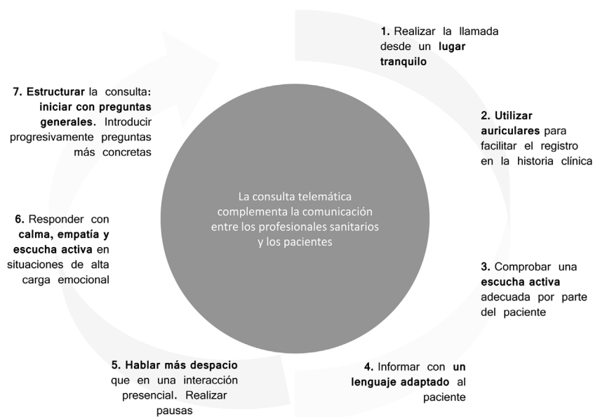
Figura 3 Algoritmo resumen de los resultados obtenidos en el Bloque 3. Comunicación con el paciente.

realiza una escucha activa (S55) y emplear un lenguaje comprensible y adaptado al paciente que resuelva sus dudas y necesidades (S58), hablando más despacio que cuando se está cara a cara y realizando pausas (S56) (tabla 3 y fig. 3).