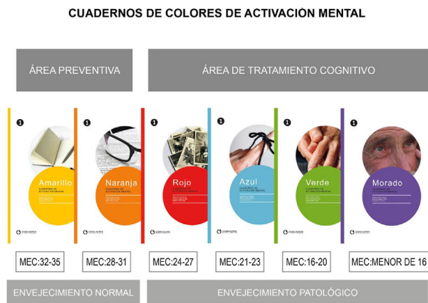
Figura 1 Material de intervención: cuaderno de colores de activación mental.

complementaria, se utilizaron ayudas externas como reloj y calendario, además de firmar y anotar la fecha en cada actividad.