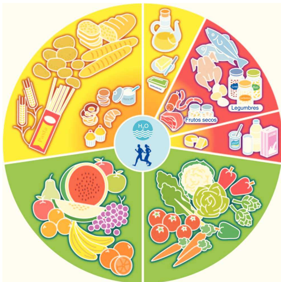
Figura 2 Rueda de los alimentos.