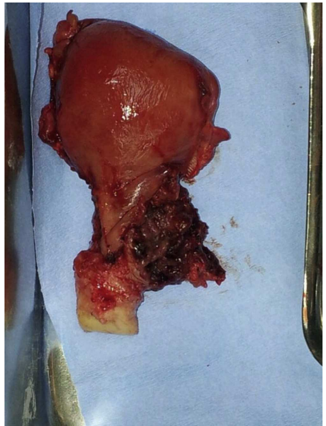
Figura 3 Pieza quirúrgica con evidencia de embarazo ectópico localizado en región de cicatriz previa.

El diagnóstico histopatológico de la pieza quirúrgica fue de embarazo ectópico en segmento uterino inferior (fig. 3).