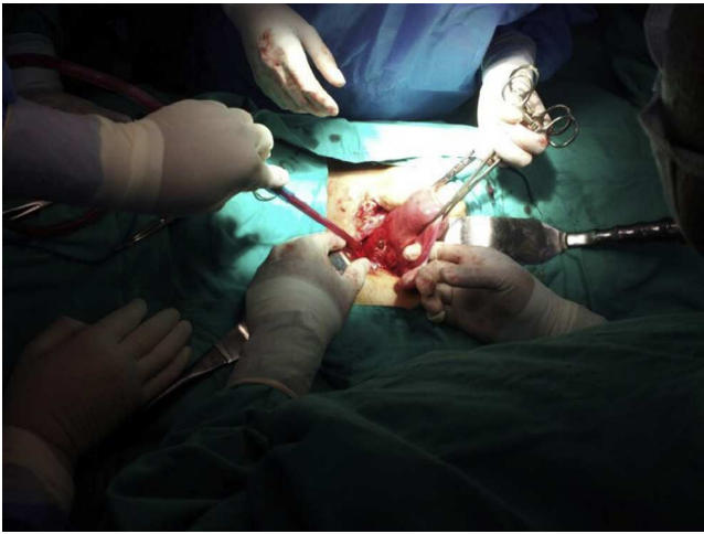
Figura 1 Saco gestacional en cara anterior del útero hacia cicatriz de cesárea previa.

transvaginal. El aspecto del cérvix es normal y no se palpan masas anexiales bilaterales.