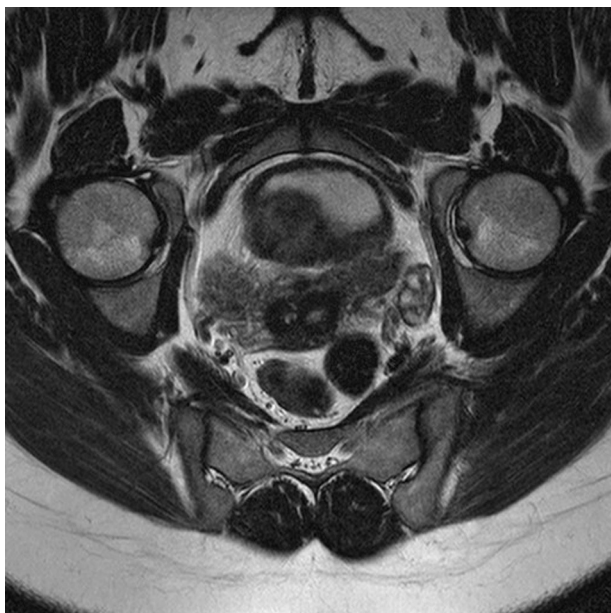
Figura 5 Resonancia magnética nuclear. Se aprecian los 2 cuellos uterinos.

da el diagnóstico definitivo: útero didelfo, bicollis y tabique vaginal longitudinal. Indicamos intervención tras el tercer aborto del primer trimestre, pero la paciente no aceptó. Está buscando el embarazo con su nueva pareja.