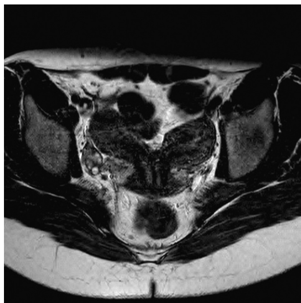
Figura 4 Resonancia magnética nuclear. Útero didelfo.

Nuestro caso es una mujer de 27 años, con 3 gestaciones y 3 abortos. Diagnosticada de tabique vaginal longitudinal, parcial alto, comprobado, en la ecografía vaginal detectamos un útero doble, didelfo. Solicitamos RMN que