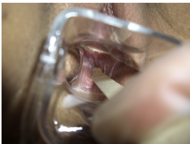
Figura 2 Imagen macroscópica. La espátula señala al fondo el inicio del tabique vaginal longitudinal, parcial alto.

En la exploración con espéculo presentaba un tabique vaginal longitudinal, parcial alto (figs. 1 y 2). Se practicó una toma para citología cervicovaginal, en la que se diagnosticó candidiasis vaginal. En la ecografía vaginal se vio un útero con 2 cavidades separadas (fig. 3), siendo las líneas endometriales (LE) de 2,2 y 2,9 mm. Los ovarios eran normales. Se solicitó RMN pélvica para el diagnóstico definitivo de la malformación. En la RMN (figs. 4 y 5) se vio un útero didelfo