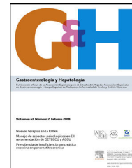
IMAGEN DEL MES