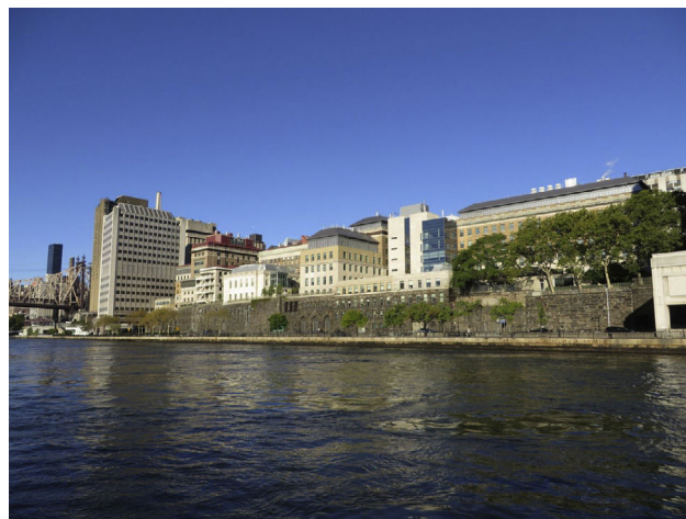
Figura 2 Edificios de la Rockefeller University en Nueva York, fundada en 1901, donde realizaron sus investigaciones 24 premios Nobel, entre ellos J. Northrop, G. Palade, Ch. de Duve, A. Claude y G. Blobel.

Blobel nació en la ciudad prusiana de Waltersdorf, actualmente Niegeslawice (Polonia). Su padre era veterinario. En enero de 1945 él y su familia huyeron hacia al oeste, a una localidad cercana a Dresde, ante el avance de las tropas soviéticas. En 1954 escaparon a Frankfurt, en donde inició los estudios de medicina que terminó en Tübingen en 1960.