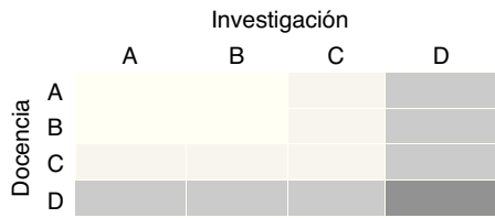
Figura 1. Matriz de evaluación del modelo de la UPC.