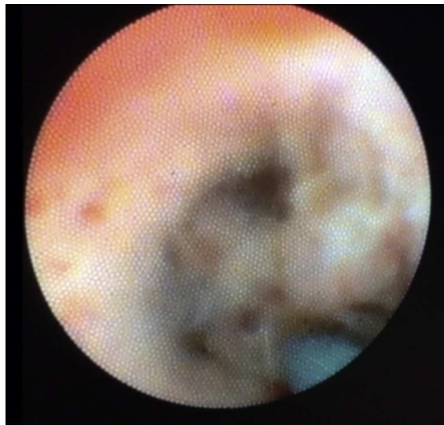
Figura 2 Colangiocarcinoma. Imagen de colangioscopia (Spy Glass®).

Todos los pacientes fueron sometidos a la ruta de diagnóstico con parámetros internacionales vigentes en la Unidad de Endoscopia del Instituto Nacional de Cancerología. Los métodos diagnósticos utilizados dependiendo de la necesidad del estudio de la patología fueron: USE lineal o intraductal, colangiografía retrógrada endoscópica, cepillado para citología de la vía biliar, colangioscopia con el sistema Spy Glass® y biopsia bajo visión directa por colangioscopia.