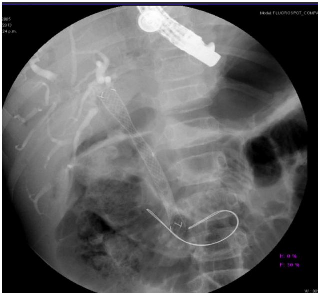
Figura 3 Prótesis metálica autoexpandible que presenta una cintura en zona de estenosis, drenaje del medio de contraste y las riendas para su extracción.

Las complicaciones biliares en el trasplante hepático oscilan en un 8-35% 7 . Thuluvath et al. 8 encontraron que el 39% corresponden a estenosis, el 30% a fuga, el 31% a defectos debidos a litos o detritus y el 23% a estenosis de la papila o disfunción del esfínter. El primer indicio para pensar en una estenosis puede ser un incremento de los niveles séricos de las transaminasas y las bilirrubinas en un paciente asintomático como ocurrió en nuestro caso por lo que se solicitó un ultrasonido que mostró la dilatación de las vías biliares intra- y extrahepáticas corroborándose mediante una CPRE