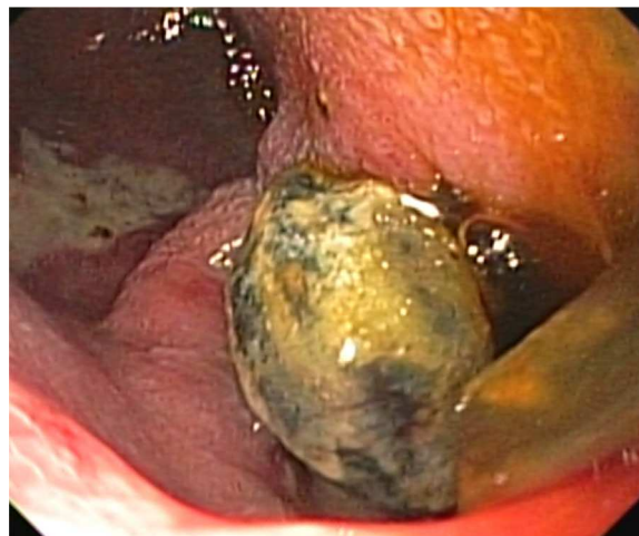
Figura 2 Cálculo biliar impactado en bulbo duodenal.

Comenzó con dolor abdominal difuso, náuseas y vómito en 3 ocasiones en posos de café de 24h de evolución. En la exploración abdominal se encontró peristalsis disminuida