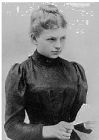
Figura 6. Clara Immerwahr, alrededor de sus 20 años. Su vida se prolongó un poco en el siglo XX, porque se suicidó en 1915.

Después de este ataque, Fritz Haber regresó a Berlín para celebrar el éxito con sus colegas de laboratorio y con los miembros del ejército. Durante la noche del primero de mayo, después de despedir a los invitados de la cena y tras una violenta discusión con él, Clara subió a su cuarto y se pegó un tiro con la Luger de su marido. Las circunstancias del suicidio de Clara no se terminaron de aclarar nunca. El suceso no apareció en ningún periódico y no existen evidencias de que hubiera una autopsia. La oscura naturaleza de su muerte ha generado mucha controversia, así como los motivos que le empujaron a cometer tal acto. Sin duda, Clara pasó a la historia por el infeliz final de su vida. Una historia trágica ésta, que nos ha conducido al fin de este relato.