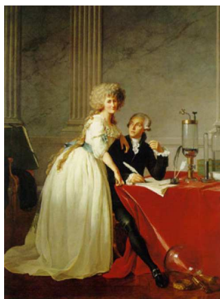
Figura 2. Retrato de los esposos Lavoisier realizada por Jacques-Louis David en 1788, que incluye la única imagen fidedigna del científico. Ambos cónyuges van vestidos al gusto de la época y ambos lucen peluca, Antoine una empolvada, Marie una de larguísimos rizos rubios.

Paulze arregló el matrimonio de su hija con Antoine, uno de sus subordinados en la Ferme , que sí era del agrado de Marie Anne. Lo que empezó como un matrimonio de emergencia, se transformó en una extraordinaria relación en la cual no sólo hubo una gran compenetración personal, sino también una fructífera relación profesional. Poco después de su matrimonio, Marie empezó a interesarse por los experimentos de Antoine y para entenderlos recibió clases de química, primero del propio Antoine, luego de sus colaboradores. Además, empezó a recibir clases de inglés para ayudar a su marido con los textos de los científicos ingleses, como Joseph Priestley y Henry Cavendish, que estudiaban los distintos tipos de “aires”, como entonces se conocían a los gases. Estos conocimientos junto con los de dibujo, que cultivó tomando lecciones de Jacques Louis David, el pintor que haría el conocido retrato de la pareja, resultaron muy útiles en el trabajo de Antoine. Una de las traducciones más significativas que realizó Marie fue la del Ensayo sobre el flogisto , de Richard Kirwan, empleada por Antoine para desmontar la teoría del flogisto.