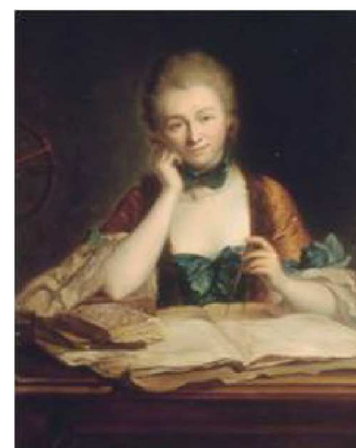
Figura 1. Retrato de la marquesa de Châtelet en la época en la que trabajaba con Voltaire en el castillo de Cirey.

en inglés y a Virgilio en latín. Además, los temores de su padre resultaron infundados, puesto que a punto de cumplir los 18 años, Émilie tuvo un pretendiente de la más rancia nobleza francesa, el marqués de Châtelet. Tras el nacimiento de su tercer hijo, la marquesa consideró que había cumplido con sus obligaciones como esposa y a partir de entonces llevó una vida independiente de su marido, aunque siempre mantuvieron una relación excelente.