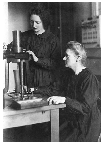
Figura 8. Marie y su hija Irène en el Instituto del Radio de París.

ciencia y cambiaba una gran parte de lo que se sabía de la antigua.