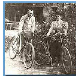
Figura 4. Foto de Marie y Pierre ante la casa de Sceaux, de los padres de Pierre, con las bicicletas que obtuvieron como regalo de boda y con las que hicieron el viaje de novios.

Estos descubrimientos desencadenaron una revolución