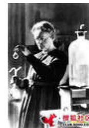
Figura 6. Marie Curie trabajando en su laboratorio.

Tras recuperarse, Marie puso en marcha la creación del Instituto del Radio, pero al finalizar su construcción estalló la Primera Guerra Mundial. Y aquella a la que habían tildado de extranjera roba maridos no dudó en arriesgar su vida y la de su hija Irène para cuidar de los soldados de adopción heridos en el frente su país. Con las camionetas denominadas “pequeñas curies”, que contenían sistemas de rayos X portátiles, Marie, su hija y las personas que ellas habían enseñado, recorrieron los frentes y realizaron más de más de un millón de radiografías de los soldados con heridas de bala.