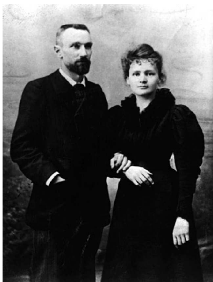
Figura 3. Foto oficial "del matrimonio".

ciencias, el primero que se habría de conceder a una mujer en la Sorbona. Con este trabajo Marie obtendría mucho más que un título de doctora, pasaría a la posteridad. Cuando Marie conoció a Pierre, éste ya era un científico que había realizado contribuciones muy relevantes en varios campos – además del estudio de las propiedades magnéticas objeto de su tesis doctoral, había descubierto la piezoelectricidad junto con su hermano mucho antes, y había estudiado las propiedades de simetría de los cristales—. A pesar de ello, Marie no se limitó a seguir la brillante estela de Pierre. Ella estaba fascinada por la naturaleza de las misteriosas radiaciones que acababa de descubrir Henri Becquerel, y decidió estudiarlas desde una perspectiva diferente a la que había empleado el eminente profesor de la Escuela de Minas y director del laboratorio del Museo de historia natural de París. Curiosamente, donde fracasó la experiencia y la tradición de Becquerel, cuya familia había estudiado las radiaciones emitidas por los minerales durante cuatro generaciones, triunfó Marie. Según algunos triunfó la aproximación química donde había fracasado la física, pero en realidad había mucha física en la cuantificación del fenómeno que hizo Marie. También hubo genialidad a la hora de plantear las preguntas y un inconmensurable trabajo para obtener las respuestas acertadas.