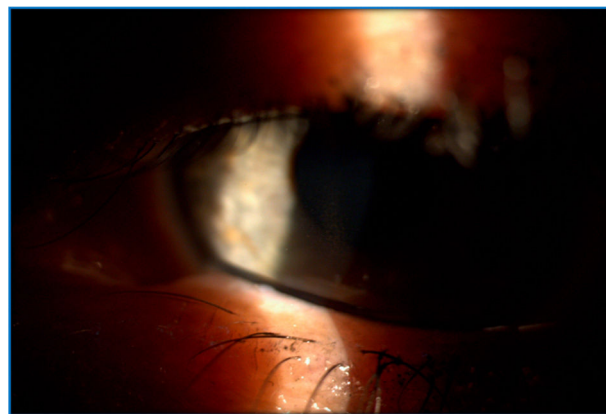
Figura 1 Huso de Krukenberg. Depósito de pigmento endotelial en forma de huso.