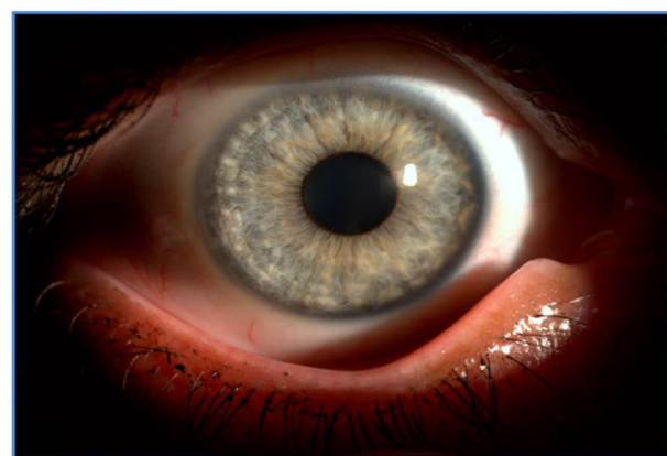
Figura 2 Alteraciones de la coloración de iris con hipocromía y atrofia periférica.