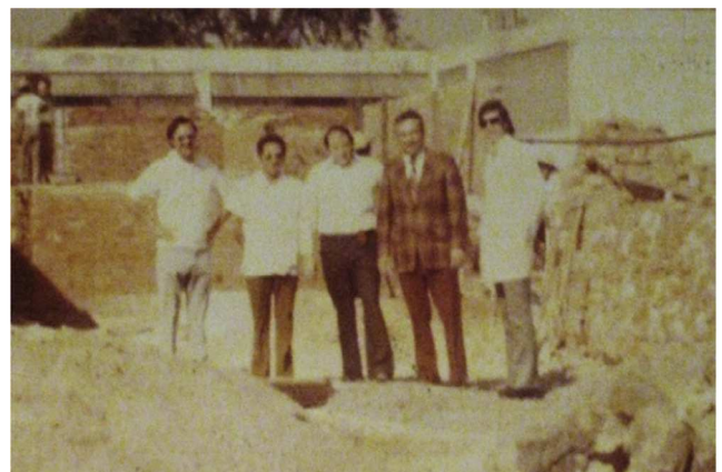
Figura 5 Construcción tercera sede.