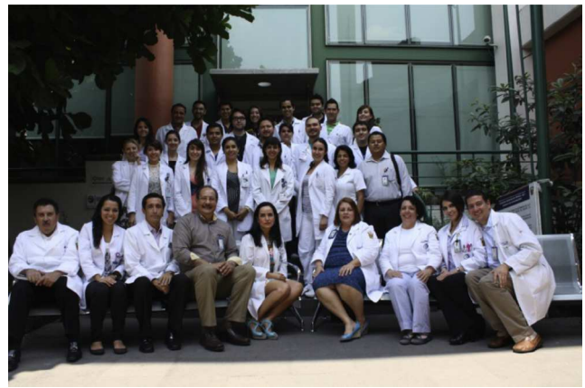
Figura 8 Personal médico de la UOAE. 2014.