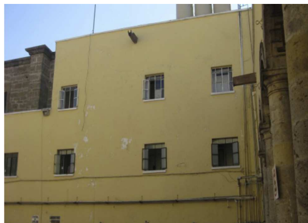
Figura 1 Primera sede.