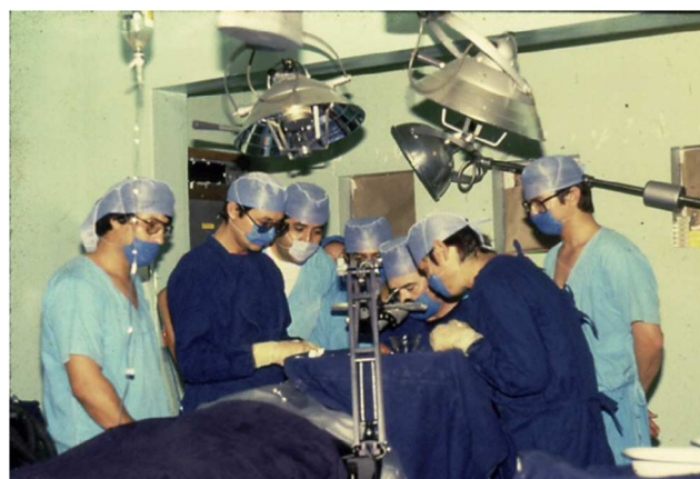
Figura 2 Cirugía de trasplante en 1969.

empresario y gran amigo del Hospital y sobre todo precursor de la Oftalmología mexicana (fig. 3).