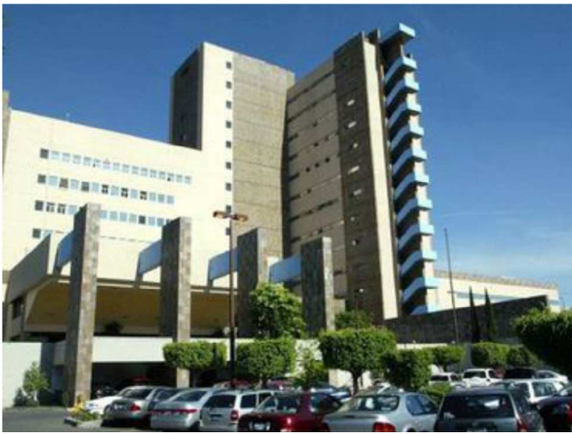
Figura 6 Nuevo Hospital Civil de Guadalajara «Dr. Juan I. Menchaca».