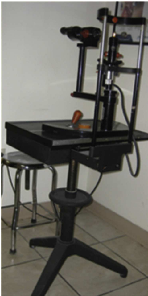
Figura 3 Lámpara de hendidura Zeiss opton.