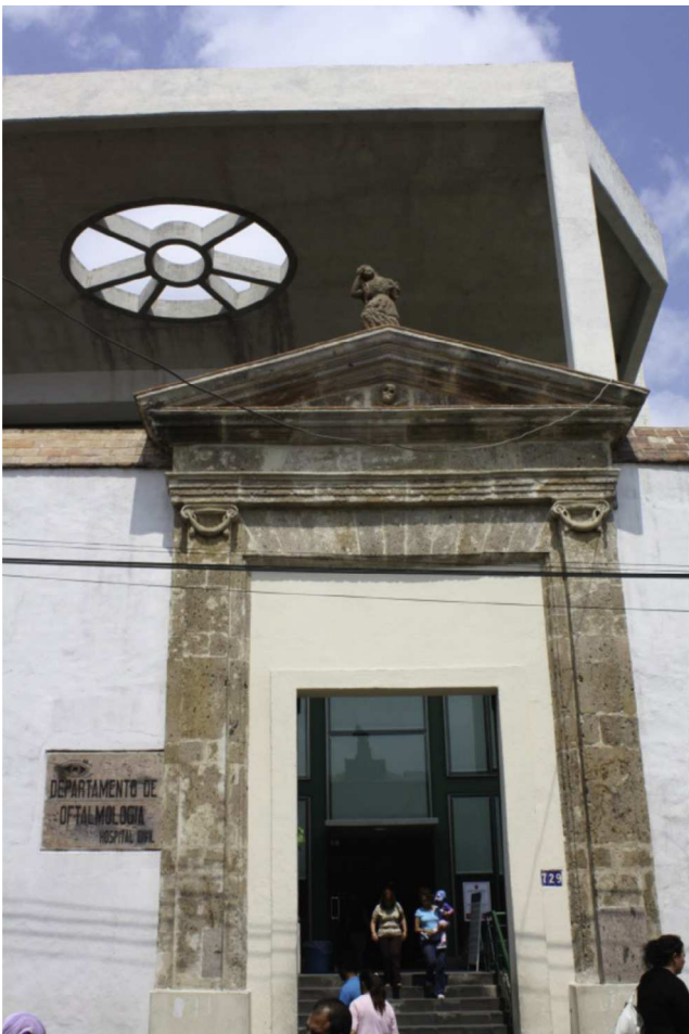
Figura 7 Entrada, pasado y presente.