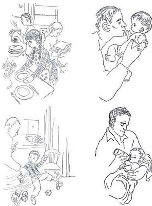
2. Collage. Matsner Gruenberg, 1956