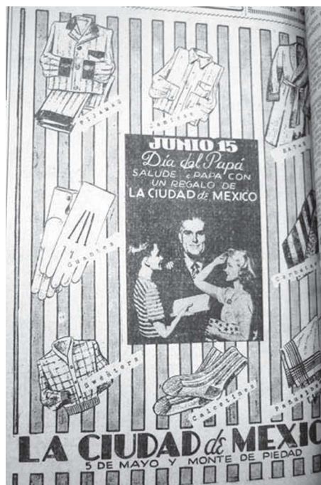
6. “Junio 15, Día del Papá”, El Universal , 10 de junio de 1942, p. 2

postura corporal que refleja alguna cercanía con su padre, pues apoya su mano izquierda sobre el hombro de su progenitor. En contraste con los anuncios publicitarios de las siguientes décadas y que analizaré más adelante, en éste se advierte, a nivel de representación, todavía cierta distancia entre padre e hijos y ninguna referencia a la relación del hombre con un ámbito doméstico.