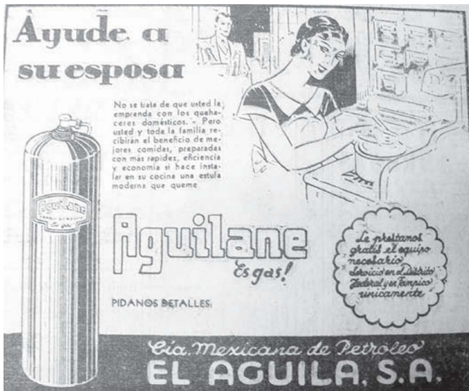
1. "Ayude a su esposa", Excélsior , 19 de julio de 1936, p. 5

la editorial Daimon, edición que probablemente fue la primera que circuló en México.