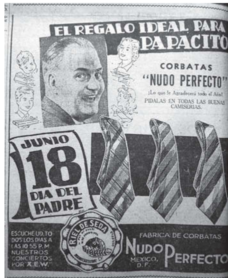
5. “El regalo ideal para papacito”, El Universal , 14 de junio de 1938, p. 4

La figura del hombre blanco, regordete, calvo sin bigote y casi en su cuarta década de vida se alejaba de ciertos ideales de atractivo masculino de la época. A su alrededor, aparecían dibujados su esposa y sus tres hijos, cada uno sosteniendo una caja envuelta para regalo. La sinergia radio-prensa se advertía en la esquina inferior izquierda del anuncio, en donde podía leerse: “escuche usted todos los días a las 10:55 p.m. nuestros conciertos por XEW”, ya que muchos programas de radio estaban financiados por empresas y gran parte de sus espacios se aprovechaban para publicidad.