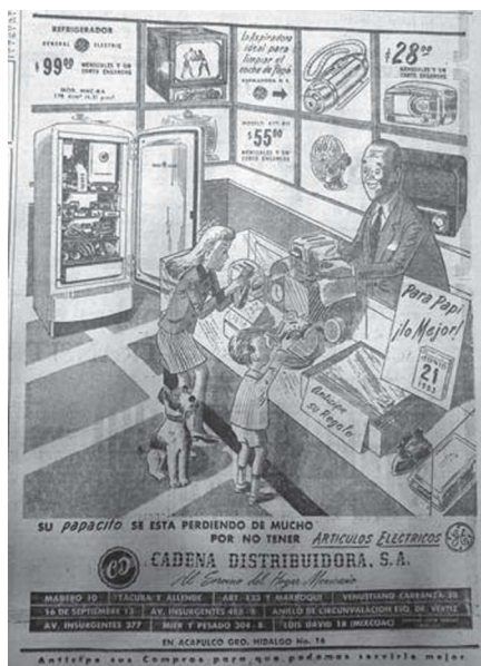
14. “Para Papi, lo mejor”, El Universal , 14 de junio de 1953, p. 9

jerárquico del padre de familia que recibía atenciones y servilismo, pero simultáneamente transgredía lo que se entendía tradicionalmente por masculinidad.