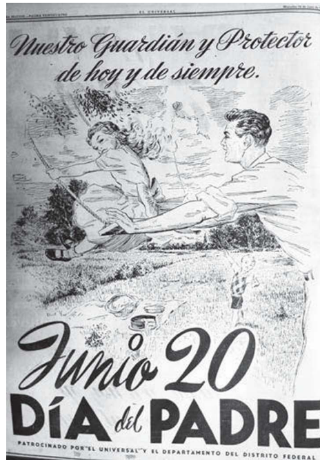
9. “Nuestro guardián y protector de hoy y siempre”, El Universal , 16 de junio de 1948, p. 24

su padre y un código de lectura parecería indicar que con esas monedas tendría que ir a comparar lo que le regalará. 69