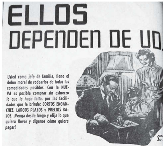
3. Detalle anuncio: "Ellos dependen de Ud.", Novedades , 3 de junio de 1947, p. 10