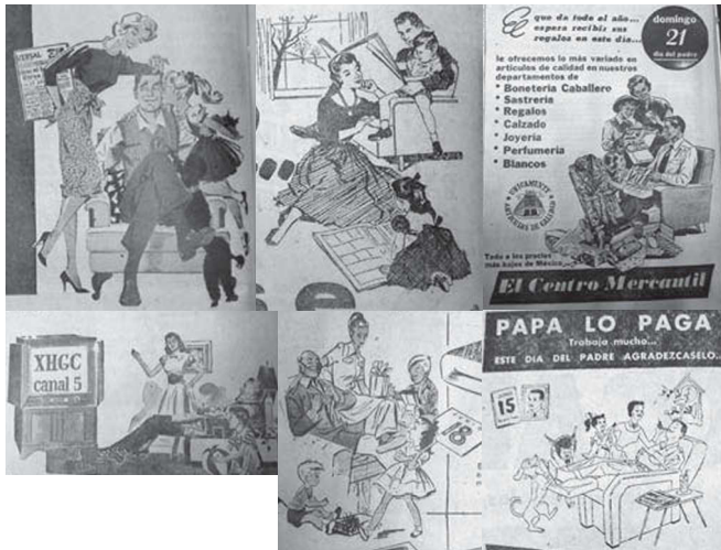
12. Detalle anuncios. El Universal , 15 de junio de 1950, p. 16; 9 de junio de 1953, p. 10; 18 de junio de 1953, p. 13; 4 de junio de 1958, p. 16; 8 de junio de 1958, p. 12; 16 junio de 1960, p. 48