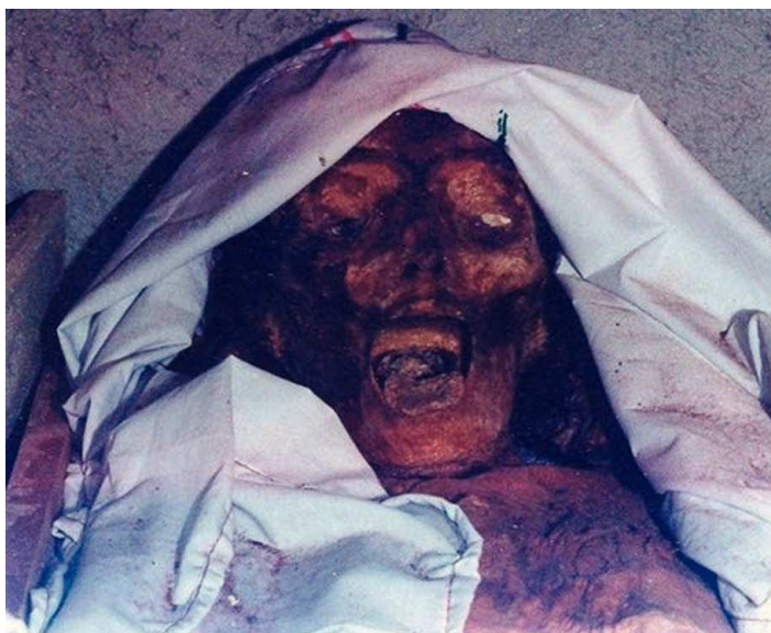
FIGURA 3. Cadáver corificado, en el cual la piel aparenta haber estado bajo un proceso de curtido. La solución de continuidad de la piel corificada probablemente se haya representado en la iconografía de Ah P'uuch.