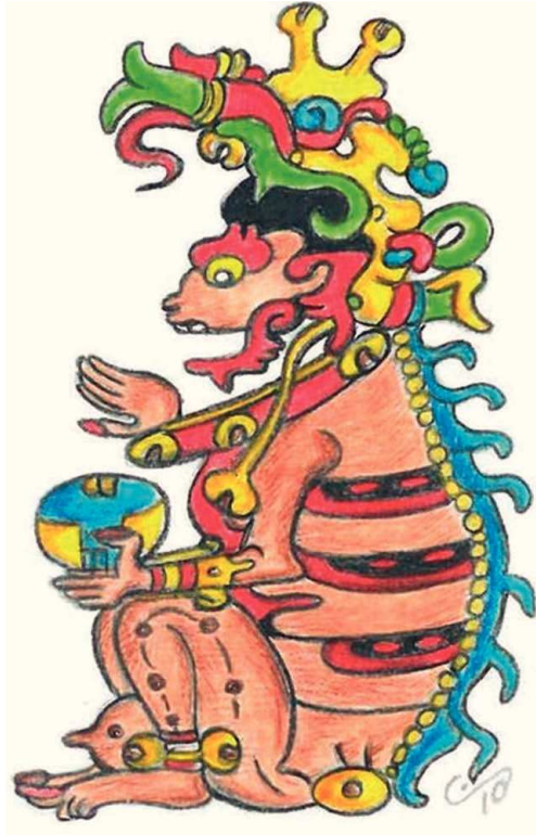
FIGURA 1. Ah P'uuch, dios maya de la muerte, en una de sus representaciones más conocidas. Dibujo de Lizbeth Rodríguez, basado en la imagen de la página 13 del Códice de Dresde .

tores (Bingham, 2010: 3), Ah P'uuch se caracteriza por presentar la piel caída y la cabeza esqueletizada, a la vez que parece sostener un cráneo; asimismo, lleva un collar de cascabeles y, trenzadas en sus cabellos, unas cuencas oculares (Rivard, 1965), a las cuales me referiré más adelante. El animal con el que se le relaciona es el búho (Arnold, 1983: 130), representado, igualmente, de manera estilizada, aunque también podemos observarlo acompañado de un perro; ambos animales están asociados a su vez con premoniciones, malos augurios, enfermedades y muerte. Muy probablemente el nexo entre la muerte y los animales descritos radique en el hecho de que el búho es un ave de costumbres nocturnas, que prefiere la oscuridad y que cruza entre distintos espacios desde el Xib'alb'a, llevando la energía negativa y nefasta del inframundo hasta los cielos, ennegreciéndolos con las nubes cargadas de lluvia (Craveri, 2012: 168), en tanto que el perro es considerado guía, protector y animal sensible ante la muerte; inclusive, en los ritos, interviene para atraer a los muertos a su renacimiento (De la Garza, 1998: 97).