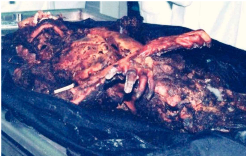
FIGURA 2. Momificación, fenómeno o proceso físico de conservación del cadáver por ausencia de putrefacción bacteriana. Momia en el cementerio de la ciudad de Tenabo, Campeche.