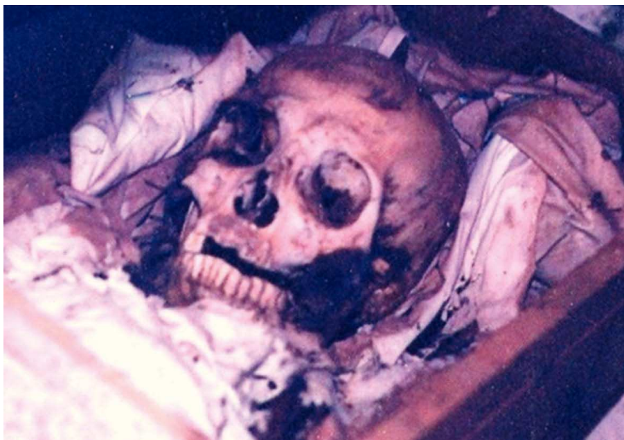
FIGURA 5. Fase de reducción cadavérica. Restos óseos en el cementerio de Tenabo, Campeche.

Para fines de este artículo, lo descrito por Rivard resulta atinado desde la perspectiva médico-forense, ya que, como él refiriera, en el Código Tro-Cortesiano (páginas 86 y 87) hay imágenes de pájaros sacándole los ojos a los prisioneros o cautivos muertos. Al arrancar los ojos de esta manera, el globo ocular sufre una deformación tal que pareciera que se estira o achata. ¿Podríamos quedarnos con esta idea? En el tocado del dios Kísín observamos muy probablemente unos globos oculares extruidos, aunque bien podría tratarse de una representación igualmente estilizada de ojos salientes de sus cavidades gracias a la acción de los gases en la fase enfisematosa ya analizada, reafirmando así la putrefacción del cuerpo fallecido.