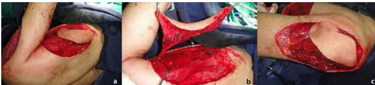
Figura 3. Imágenes intraoperatorias de la disección del colgajo.

la arteria toracodorsal. Se incide el músculo hasta lograr disección del pedículo, y se lo liga distalmente (figura 3). Las perforantes que se originan de la rama descendente de la arteria toracodorsal son las que se escogen por sobre aquellas originadas de la rama transversa, porque, típicamente, tienen un curso intramuscular más corto y con menor número de ramas nerviosas.