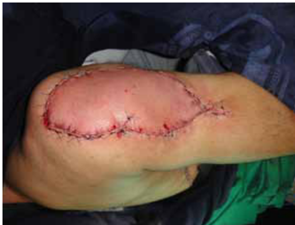
Figura 4. Resultado postoperatorio inmediato.

Otra gran ventaja de este colgajo es la longitud del pedículo, que, en promedio, es de 14 cm \pm 1,4 cm; este colgajo puede alcanzar defectos más mediales en la pared del tórax, comparado con el escapular o el paraescapular (10). Cuando el colgajo está basado en una perforante distal, la longitud del pedículo puede alcanzar hasta 25 cm, lo cual da un arco de rotación que permite alcanzar la pared anterior del tórax, la clavícula,