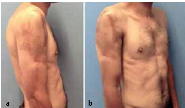
Figura 6. Aspecto postoperatorio tardío. a) Vista lateral. b) Vista oblicua.

La congestión venosa en los colgajos en isla puede ser resultado de la compresión venosa dentro del túnel creado para su transposición, por lo cual se recomienda su disección amplia. En el caso objeto de estudio, la congestión venosa cedió espontáneamente al cabo de unos días, sin que requiriera una intervención adicional; así pues, el equipo a cargo del presente trabajo considera que esta eventualidad no se debió a problemas técnicos con la creación del túnel subcutáneo. La necrosis parcial se puede presentar cuando el colgajo se extiende más allá del territorio vascular.