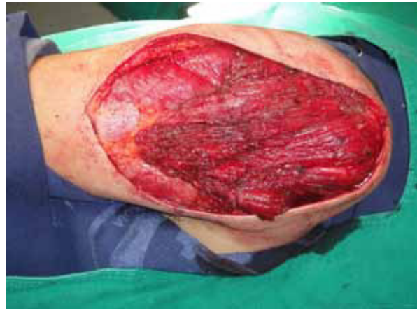
Figura 2. Defecto resultante posresección local amplia.

El manejo del paciente fue quirúrgico; se realizó resección local amplia con márgenes oncológicos, que presentó defecto con compromiso de toda la cara lateral del brazo derecho, sin exposición ósea o tendinosa (figura 2), y cubrimiento inmediato con colgajo de perforantes de