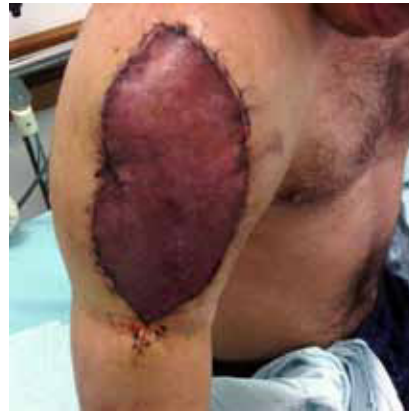
Figura 5. Colgajo congestivo a las 48 horas después de la operación.

la axila, el brazo posterior y el borde lateral del esternón (11-13). La tensión sobre el pedículo se debe evitar, por cuanto eso puede conllevar ruptura de las pequeñas perforantes.