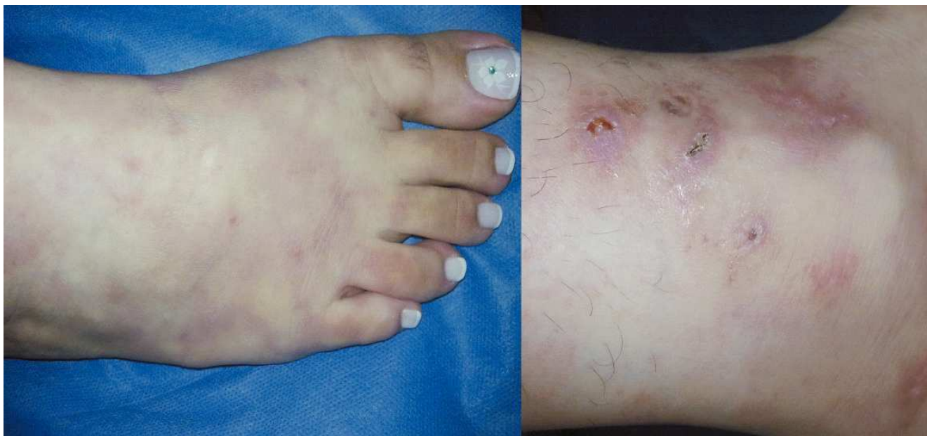
Figura 2. Diferentes estadios de la vasculopatía livedoide. En la foto del lado izquierdo se observan lesiones violáceas en forma de red en el dorso del pie. La foto de la derecha muestra una fase más avanzada de ulceraciones superficiales con áreas de hiperpigmentación.

Se presentan unas lesiones reticulares o violáceas desproporcionadamente dolorosas alrededor de los maléolos conocidas como livedo racemosa; dichas lesiones pueden evolucionar a úlceras en sacabocado de 3-8 mm de diámetro (Figura 2). Las piernas son el lugar más frecuentemente afectado seguidas de los tobillos y la superficie dorsal del pie en menor proporción 20 . Posteriormente de días a semanas pueden aparecer úlceras rodeadas por telangiectasias