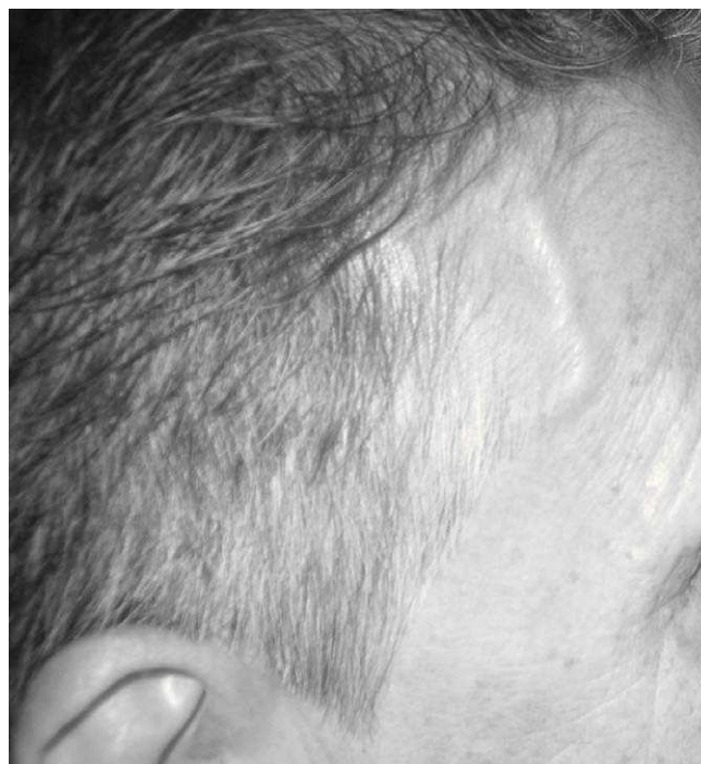
Gráfica 3. Engrosamiento de la arteria temporal en uno de los pacientes con diagnóstico de arteritis de células gigantes.

Los síntomas polimiálgicos pueden ser una manifestación inicial de la AR, LES o las espon-