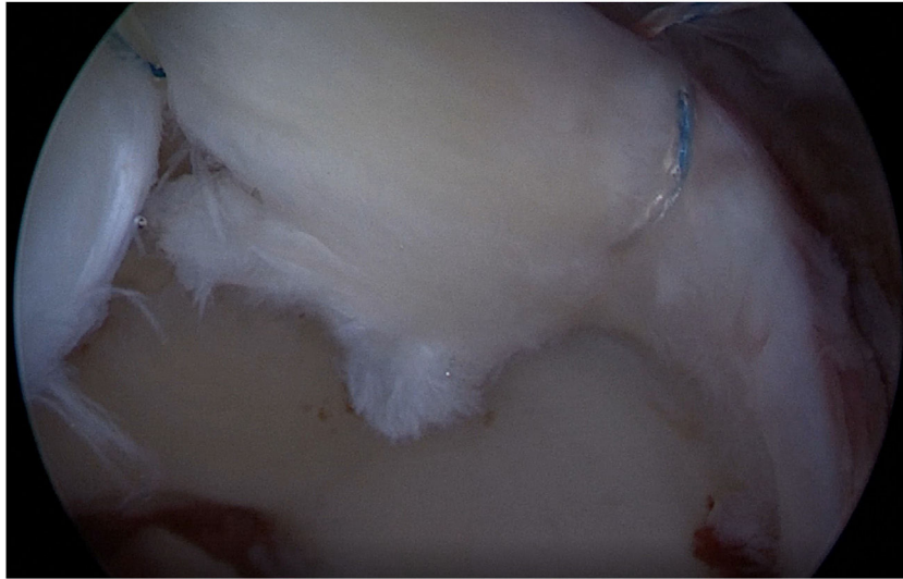
Figura 2 Lesión condral por inestabilidad (Zona 3).

intra-articular encontrado para los 13 casos y en la tabla 2 , se muestra la descripción de las zonas intervenidas ( fig. 3 ).