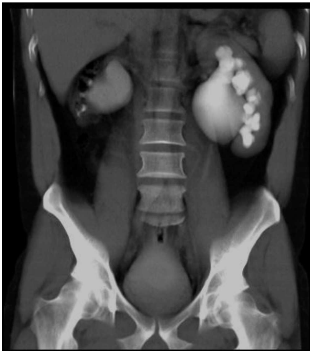
Figura 3 Imagen de urografía excretora.