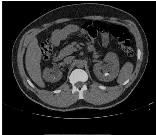
Figura 1 Corte axial de uro-TAC.

Paciente de 56 años, con cuadro clínico de 3 años de evolución de dolor lumbar y hematuria macroscópica intermitente (figs. 1-5).