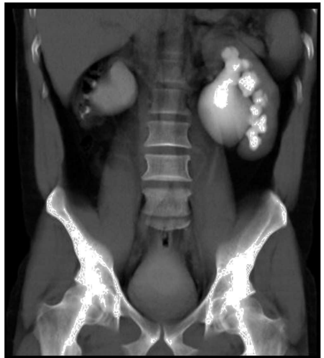
Figura 4 Imagen de urografía excretora por TAC.