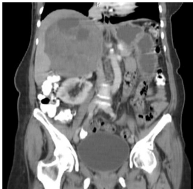
Figura 1 Cortes sagitales de la tomografía. Masa suprarrenal derecha.

La patología reportó una masa que pesó 900g y midió 12,8 × 10,5 × 9 cm, de color pardo-rosado, de superficie lisa, encapsulada y de consistencia renitente. Al corte fue amarillento con zonas blanquecinas entremezcladas. Se identificó una lesión de aspecto quístico que midió 6 × 5,5 × 4 cm que estaba ocupada por material sanguinolento.