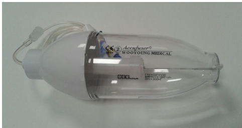
Figura 3 Infusor elástico modelo Accufuser® C0020L (Woo Young Medical Co., Ltd.).

Se contactó con el equipo de cuidados paliativos domiciliarios para seguimiento y cambio de sistema elastomérico cada cinco días, con el objetivo de evitar la movilización frecuente de la paciente al hospital. Se planearon revisiones con analítica progresivamente espaciadas en el tiempo conforme a la estabilidad clínica. La dosis de furosemida se mantuvo idéntica en las revisiones sucesivas. El manejo de síntomas fue óptimo, con mejoría notable de la disnea y desaparición de edemas en miembros inferiores, así como ausencia de nuevas reagudizaciones y reingresos y mejoría de la función renal, con estabilidad electrolítica.