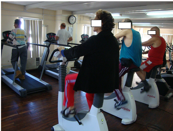
Figura 2 Pacientes infartados, con disfunción ventricular izquierda severa, adscritos a un programa de ejercicios físicos supervisados, en un cicloergómetro vertical de entrenamiento con una velocidad de pedaleo de 50 revoluciones por minuto; otros en una correa sinfín realizando una caminata o carrera, todos con una intensidad de ejercicio necesaria para alcanzar y mantener el pulso de entrenamiento determinado previamente mediante ergometría.