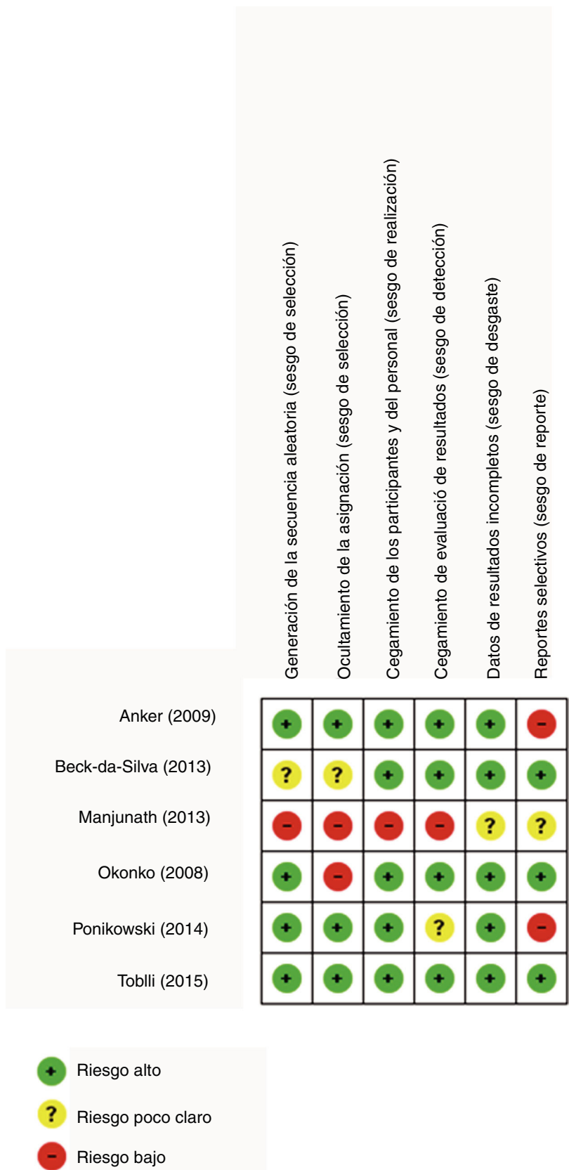
Figura 2 Resumen de riesgo de sesgos de estudios incluidos.