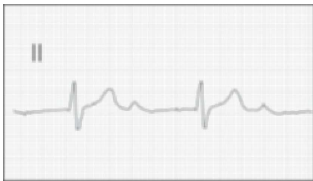
Figura 2. Bloqueo aurículo-ventricular de primer grado.

descartaron alteraciones en el cromosoma 19 y otros locis asociados con defectos de la conducción. Por el papel potencial de la corriente de sodio en la conducción infranodal, se evaluó el gen SCN5A identificando una mutación en los miembros afectados de otra familia. Weng y colaboradores (21) demostraron en una familia con BAVFI una mutación de G por A en la posición 4783 del gen SCN5A, el cual reemplazaba un residuo de ácido aspártico por asparagina en la posición 1595. Esta mutación afecta la subunidad beta 1 del canal de sodio de las células mamíferas, demostrado por ingeniería recombinante. La alteración lleva a un defecto en la cinética de inactivación del canal, diferente a la encontrada en el LQT3, siendo este el mecanismo que se relaciona con la enfermedad de conducción. Más recientemente, Viswanathan y su equipo (22) identificaron una transición heterocigota 1535C-T en el gen SCN5A y una transición homocigota 1673 A-G en el mismo gen, en una familia con BAVFI; los autores sugieren que existe un aumento en la inactivación lenta que afecta de modo desproporcionado las células de Purkinje, las cuales tienen un potencial de acción de mayor duración con más pequeño intervalo diastólico lo cual conlleva a la identificación de la conducción aurículo-ventricular.