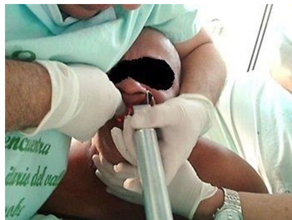
Figura 5 – Maniobra de intubación en prono.