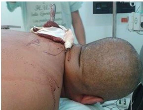
Figura 1 – Paciente en posición prono con cuchillo clavado en columna torácica.

Los estudios imagenológicos con tomografía computarizada de tórax (fig. 2) fueron realizados en PP. Se descartó neumotórax y se estableció la posición exacta de la hoja del