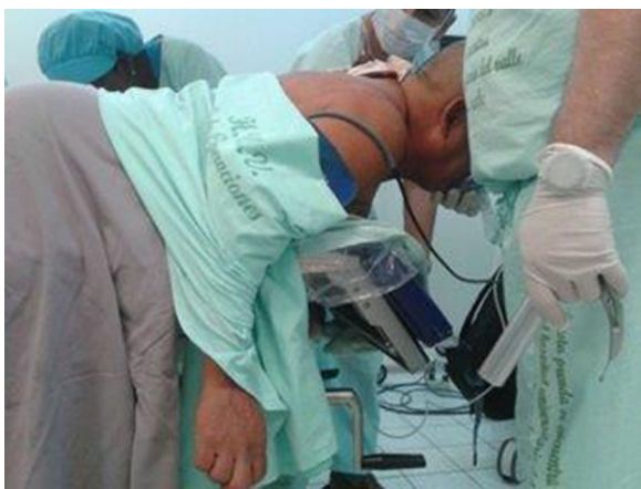
Figura 3 – Preoxigenación del paciente en posición prono.