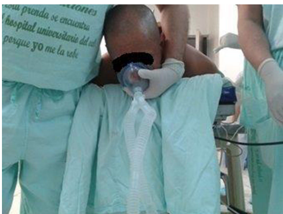
Figura 4 – Posicionamiento del anesthesiólogo para intubación en prono.