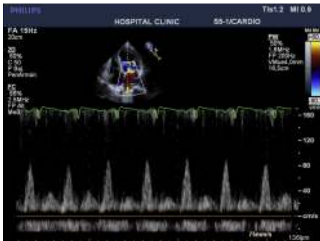
Figura 2 – Eco transtorácica preoperatoria relación onda E/onda A 8 cm/s.