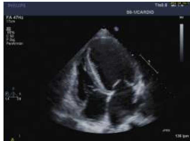
Figura 3 – Eco transtorácica 2 meses postoperatorio. Fracción de eyección 42%.