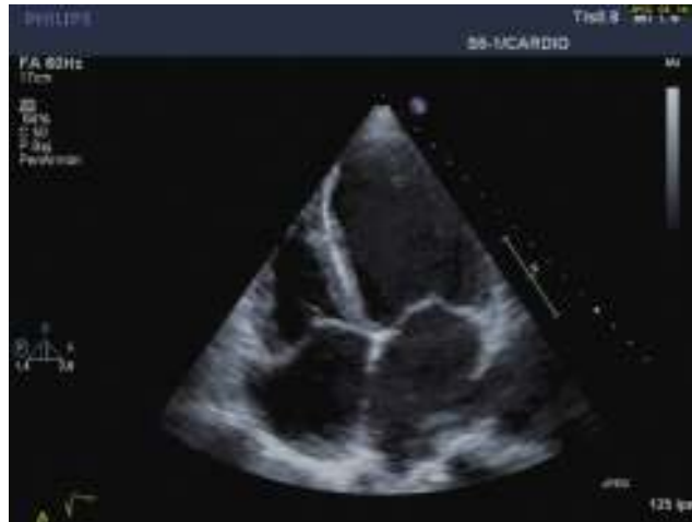
Figura 1 – Eco transtorácica preoperatoria. Fracción de eyección 20%.

Reportamos el caso de una paciente de 42 años de edad, sin antecedentes patológicos importantes, ingresada en la unidad coronaria con síntomas de ansiedad, polipnea, sudoración, dolor y distensión abdominal. A su admisión presentaba presión arterial lábil entre 180/120 y 95/60 mmHg, frecuencia cardiaca de 115 x min, soplo sistólico mitral e ingurgitación yugular. El electrocardiograma evidenciaba taquicardia