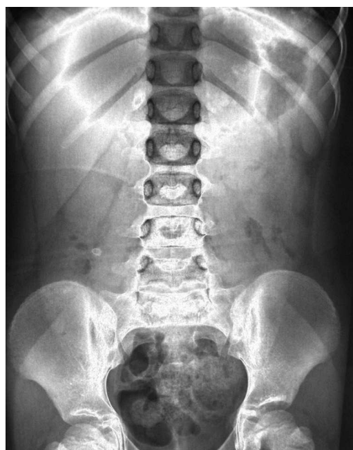
Figura 2 Relieve-radiografía de abdomen.

Actualmente las imágenes en relieve se pueden conseguir con editores gráficos mediante sistemas informáticos, reduciendo su uso a fines ilustrativos y educativos 5 . No obstante, hasta la primera mitad del siglo xx, la relieve-radiografía fue considerada por algunos profesionales un complemento importante de la radiografía convencional. En su momento, se creía que iba a ser de gran ayuda en el campo de la radiología diagnóstica, al resultar más fácil de reconocer las sombras de los órganos abdominales o los riñones. El tiempo ha demostrado, sin embargo, que las radiografías