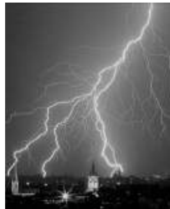
Figura 2 La tormenta eléctrica es un fenómeno natural caracterizado por rayos y fuertes truenos.