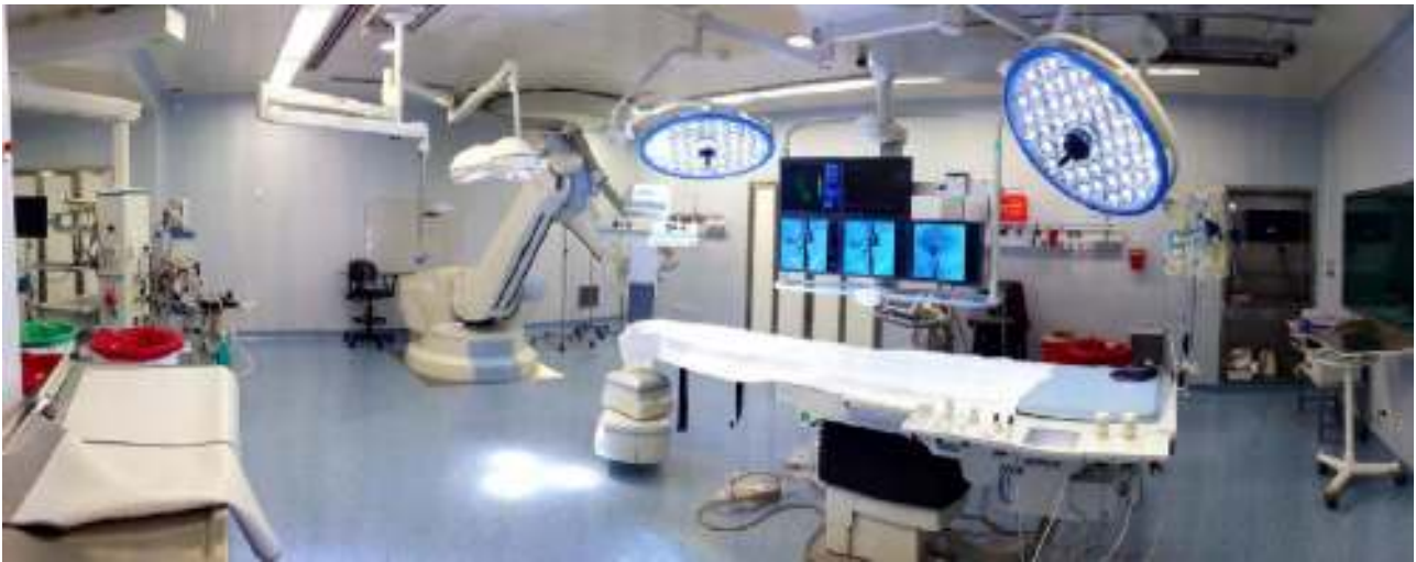
Figura 1 Angiotomógrafo Artis Zeego.

las agujas en las zonas correspondientes para la termólisis, constatándose su posición con DynaCT (fig. 3). Una vez corroborada la adecuada localización de las agujas, se retiró su mandril y se fijaron los electrodos, reconfirmando la correcta disposición por medio del estímulo sensitivo y motor, realizado por el equipo de radiofrecuencia. Por último, se ejecutó la termólisis de la rama medial del nervio dorsal en el nivel en cuestión.