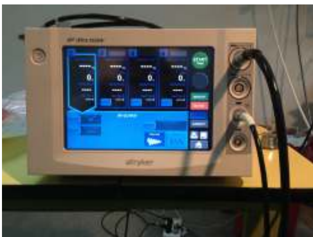
Figura 2 Equipo de radiofrecuencia Stryker.

Durante y después del procedimiento se valoró en cada paciente la presencia de complicaciones inmediatas posintervención, al mes y a los tres meses. En este último control,